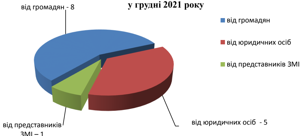
Кількість запитів на інформацію за категорією, що надійшли до Держлікслужби у грудні 2021 року