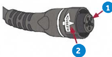
Рисунок 1 – вигляд з'єднувачів