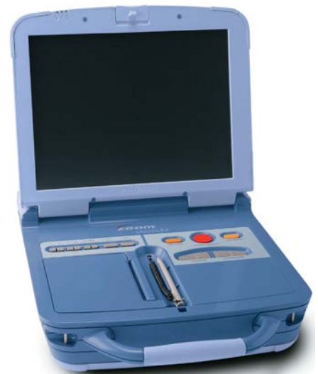
Рис. 1. Програматор ZOOM моделі 3120